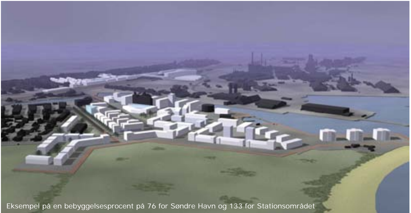
Eksempel på en bebyggelsesprocent på 76 for Søndre Havn og 133 for Stationsområdet